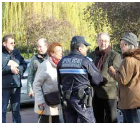
Une visite de quartier sur le thème de la propreté urbaine

Renseignement : cabinetdumaire@mairie-brunoy.fr