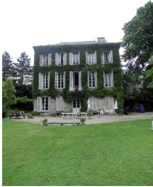
Villégiature (propriété Bouel)