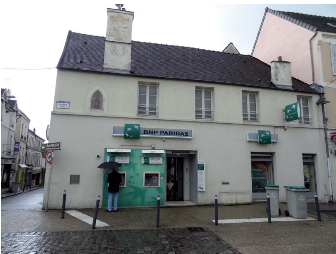
Maisons de bourg rurale (18-19e siècles)

L'analyse architecturale intègre par ailleurs une réflexion sur les performances énergétiques des bâtiments, afin de réfléchir aux moyens de les améliorer. Dans le cadre de l'AVAP, l'enjeu est de questionner la pertinence de l'isolation thermique par l'extérieur, tout en préservant les qualités patrimoniales des constructions.