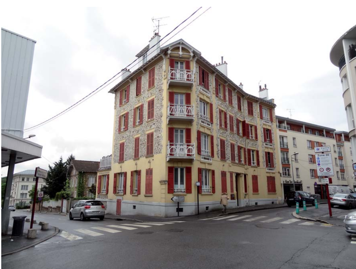
Immeuble de rapport (19e-début 20e siècles)