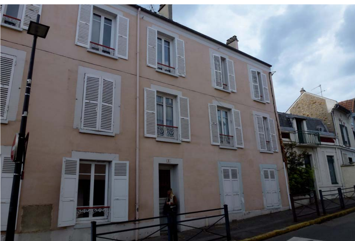
Maison de bourg (19e siècle)