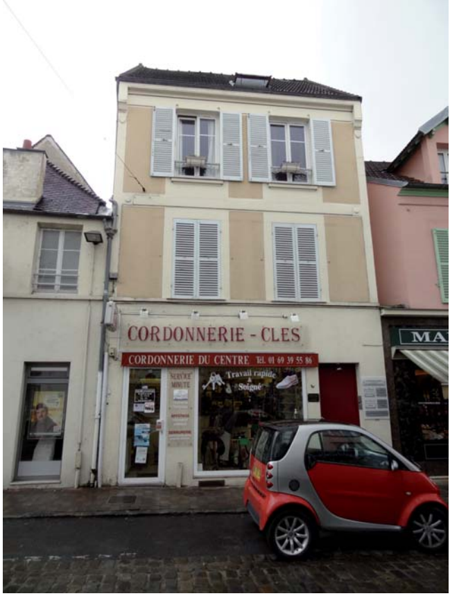
Bâti de bourg