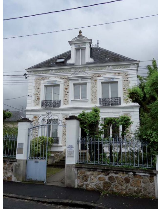
Architecture de villa