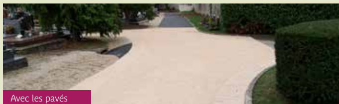
Avec les pavés

Ces aménagements faciliteront la circulation des personnes en situation de handicap et à mobilité réduite, dans l'enceinte du cimetière.